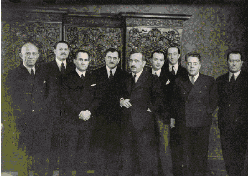
Delegațiile României, Cehoslovaciei și Iugoslaviei la cea de-a treia Conferință a guvernatorilor băncilor centrale din țările Micii Înțelegeri Belgrad, 30-31 martie 1936